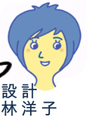
設計 林 洋子

冬は朝・晩の薪ストーブだけで 暖かく暮らせているそうです (エアコンは夏だけ!)