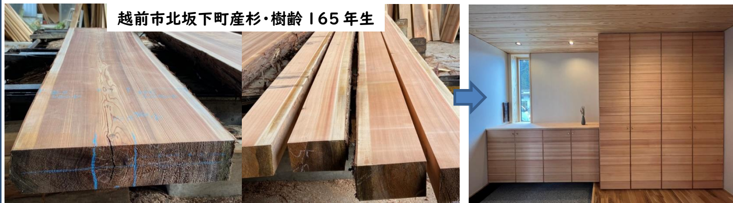
越前市北坂下町産杉・樹齢165年生

私が貢献できるのは、これからも自社製材品の利活用と心得、木の品格・魅力を大切にしながら県産スギ材の家具、建具材のしつらえデザインをより追及することを念じています。