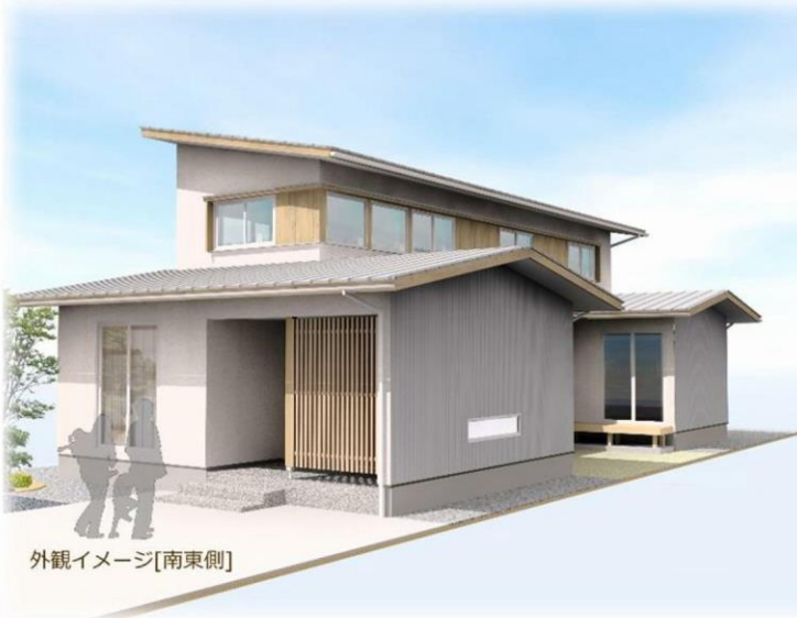
外観イメージ[南東側]

福井市の東部に位置する東郷地区で木だて家のあたらしい家づくりが始まります♪ 越美北線東郷駅のほど近く、田園地帯だった広い敷地を土地区画整理してできた新しい住宅団地の一角に位置しており、豊かな自然環境に囲まれながらゆったりとした暮らしが期待できそうです。 こちらの敷地の条件とお施主さまご家族の暮らし方に合わせた、木だて家のすまい[自然の恩恵～陽あたり、風のとおり、眺望～を十分に活かした家]を、お施主さまと何度も話し合いながらプランニングを進め、最終的な計画が完成しました。 これからは実際のカたちになっていくのを最後までお手伝いさせていただきますね!!