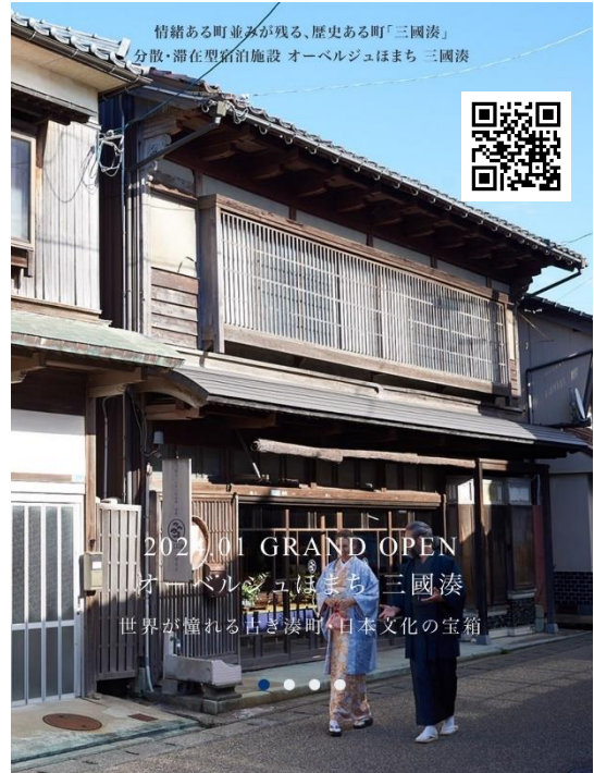
オーベルジュほまち 三国湊